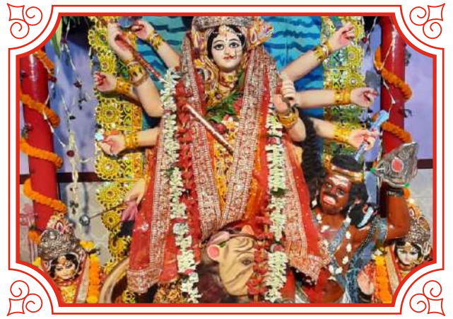
Jhauwa Kothi, Bhagalpur