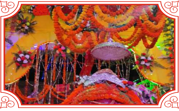
Rampur Dih Dariyapur